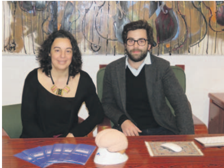
L'Elisa Estradé i el Sydney Pinoy estan al capdavant de Neurocenter

Col·loquem el casc amb els sensors que enregistren les ones cerebrals. Si aquestes ones es-